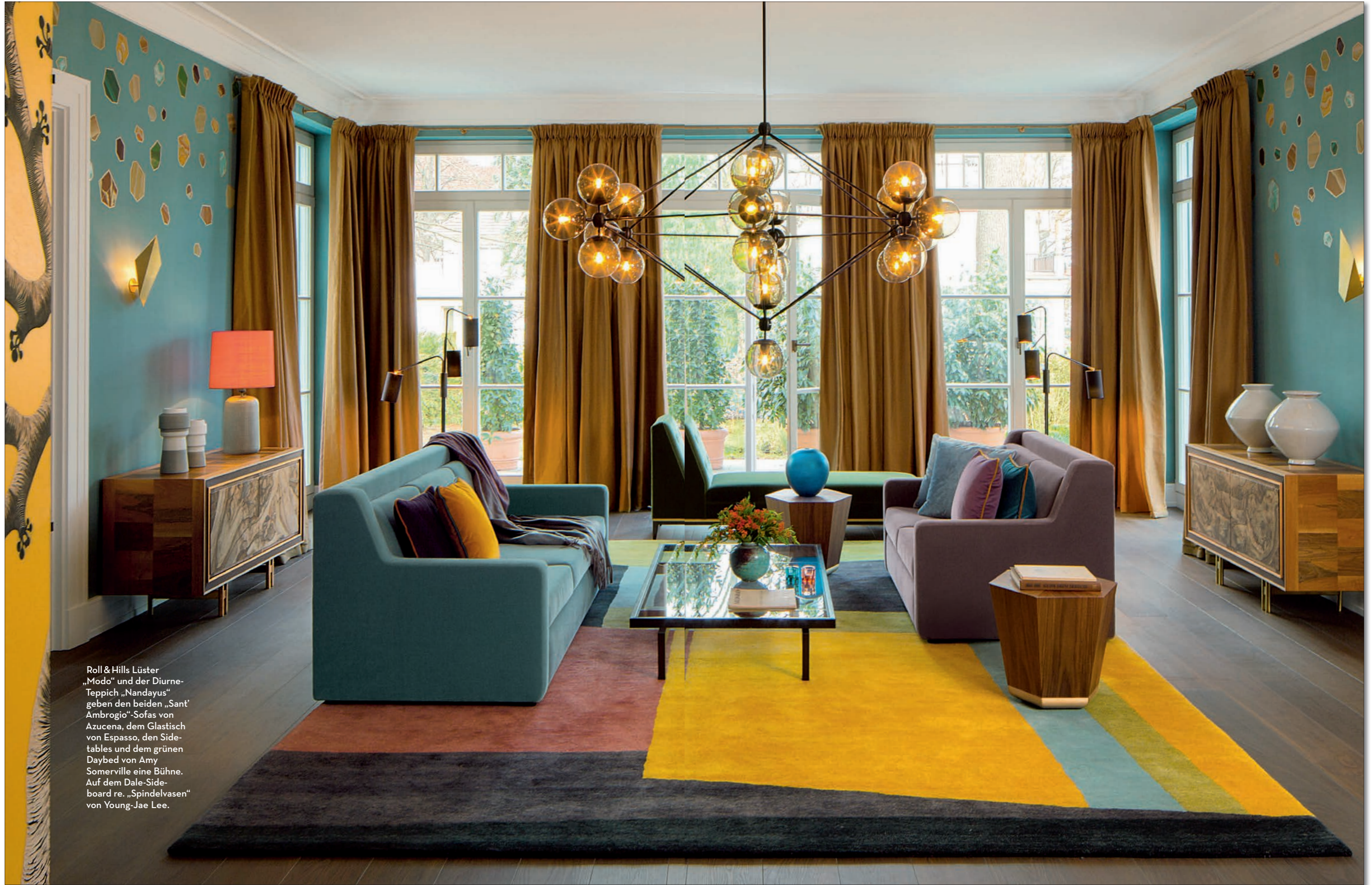
Roll & Hills Luster „Modo“ und der Diurne-Teppich „Nandayus“ geben den beiden „Sant’ Ambrogio“-Sofas von Azucena, dem Glastisch von Espasso, den Side-tables und dem grünen Daybed von Amy Somerville eine Bühne. Auf dem Dale-Sideboard re. „Spindelvasen“ von Young-Jae Lee.