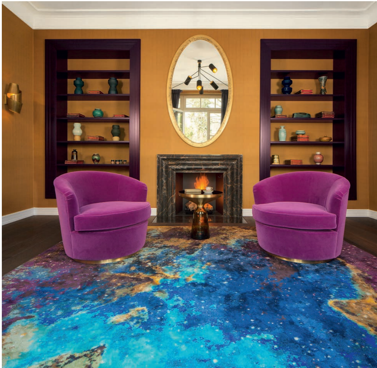
Auf den azurblauen Weiten von Jan Kath's „Space 2“-Teppich schweben die „Swivel Chairs“ von Amy Somerville. Den Spiegel und die Bibliothekseinbauten fertigte Thomas Schmitter, in den Regalen Keramiken von Lutz Könecke, Martin Schlotz und ein musealer Mix über Galerie Theis. An der Wand Hervé van der Straetens Applik „Ruban“. Unten: Kristall „Palatin“ von Theresienthal. Alle Info im AD Plus.

D raußen ist es Abend geworden, Frühlingswind raschelt in den Buchenhecken, über den Garten senkt sich die Dämmerung. Und während vor den Fenstern der hellgrüne Hauch auf den Bäumen in sanftes Grau übergeht, glühen drinnen die Farben. Auf dem Blau der Seidentapete rieseln gemalte Steine von der Decke, schimmern, bronzefasst und facettiert, im Schein der Wandleuchten – türkis, braun gesprenkelt, karamell, violett und gelb geflammt, mala-