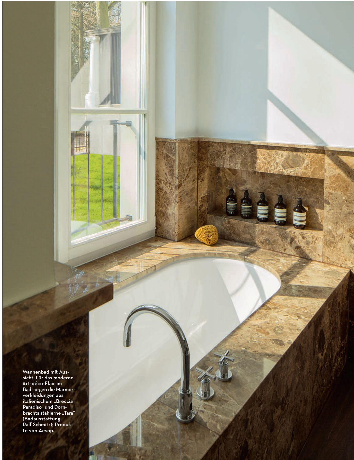
Wannenbad mit Aussicht: Für das moderne Art-déco-Flair im Bad sorgen die Marmorverkleidungen aus italienischem „Breccia Paradiso“ und Dornbrachts stählerne „Tara“ (Badausstattung Ralf Schmitz); Produkte von Aesop.