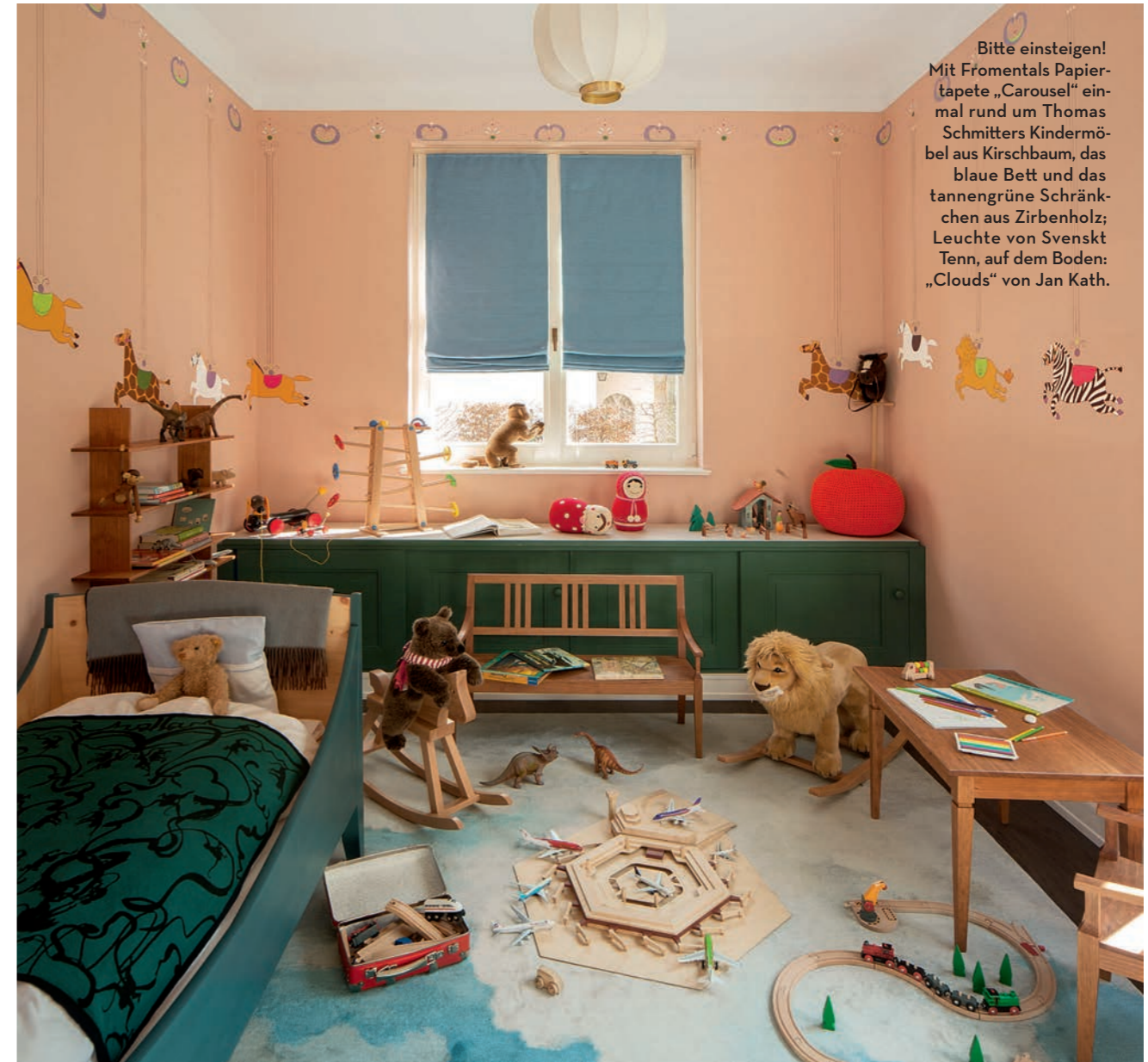
Bitte einsteigen! Mit Fromentals Papiertapete „Carousel“ einmal rund um Thomas Schmitters Kindermöbel aus Kirschbaum, das blaue Bett und das tannengrüne Schränkchen aus Zirbenholz; Leuchte von Svenskt Tenn, auf dem Boden: „Clouds“ von Jan Kath.