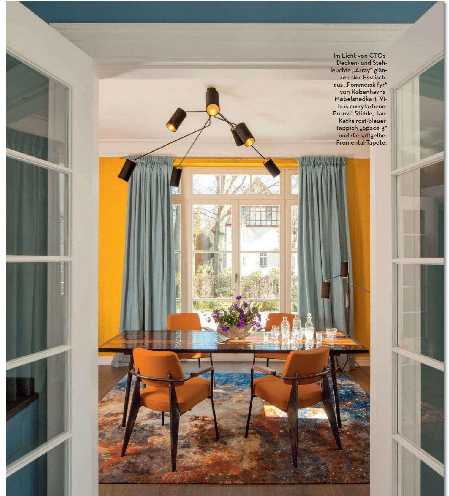
Im Licht von CTOs Decken- und Stehleuchte „Array“ glänzen der Esstisch aus „Pommersk fyr“ von Københavns Møbelsnedkeri, Vitras curryfarbene Prouvé-Stühle, Jan Kath's rost-blauer Teppich „Space 3“ und die sattgelbe Fromental-Tapete.

chit- oder jadegrün; Dessins, die sich in den Holzintarsien der beiden Sideboards wiederfinden, in den Steinformen der Appliken, den sechseckigen Holztischen, selbst in der Diamantstruktur des großen Lüsters mit den 21 Glaskugeln, der im Wohnzimmer Hof hält. Garnelenrosa, wasserblau und bernsteinfarben glimmen dazu die Raffiaschirme und Glasfüße der Tischleuchten. Töne, die mit den Seidentapeten der anderen Zimmer und dem Schimmer von Bronze,